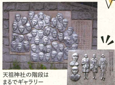
天祖神社の階段はまるでギャラリー