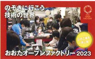
おおたオープンファクトリー 2023